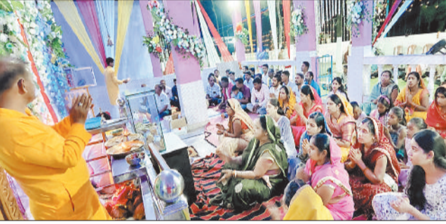
हरिभूमि न्यूज | पटथलगांव

नगर से 9 किलोमीटर की दूरी में स्थित ग्राम कछार शिव शक्ति मन्दिर में नवरात्र का पर्व धूमधाम से मनाया जा रहा है। प्रति वर्ष की तरह ही इस वर्ष भी शिव शक्ति मन्दिर आसपास के गांव सहित दूर-दूर से माता रानी के दर्शन करने भक्त पहुंच रहे हैं। पूरे मन्दिर