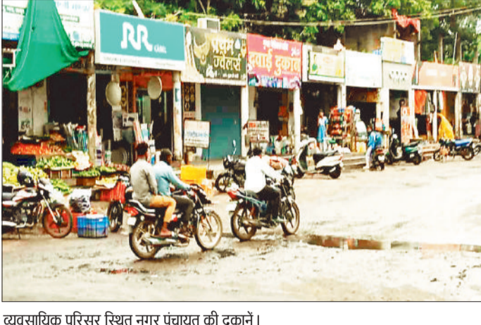
व्यावसायिक परिसर स्थित नगर पंचायत की दुकानें।

हरिभूमि न्यूज ►► विश्रामपुर नगर पंचायत विश्रामपुर द्वारा बस स्टैंड के उत्तर दिशा में वर्ष 2015-16 में निर्माण की गई व्यावसायिक परिसर की 15 दुकानें अब मरम्मत के अभाव में जर्जर हो रही हैं, उक्त व्यावसायिक परिसर की दुकानों के निर्माण करने का उद्देश्य नगर में व्यापार व रोजगार को बढ़ावा देने व राजस्व शुल्क को वृद्धि करना था।